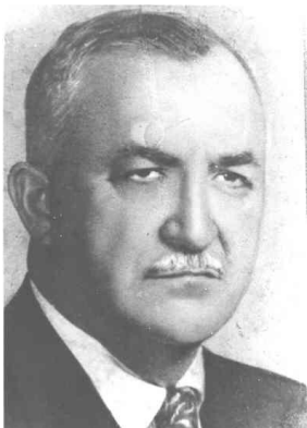
José Filomeno Gomes Partido Social Democrático - PSD