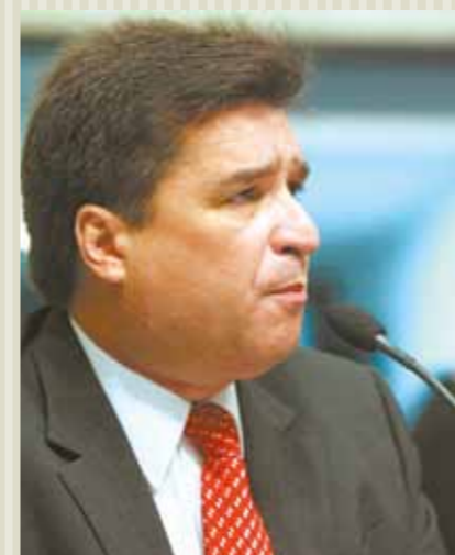
>> Deputado João Jaime (PSDB)