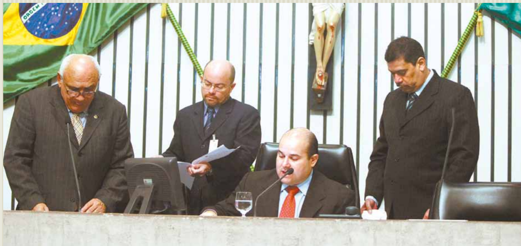
>> Presidente Roberto Cláudio (PSB) preside a primeira sessão do segundo semestre de 2011

A Assembleia Legislativa do Ceará reiniciou no dia dois de agosto as sessões plenárias referentes à 28ª Legislatura. Os trabalhos foram retomados com o início da tramitação de várias proposições na pauta da Casa. Duas mensagens, um projeto de lei, um de indicação e dois ofícios foram lidos na referida sessão.