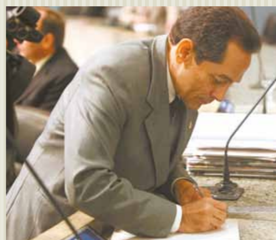
>> Deputado Heitor Ferrer (PDT)