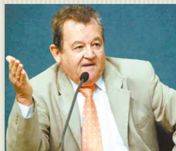
>> Deputado Gomes Farias (PSDC)