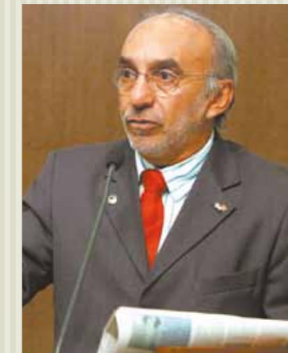
>> Deputado Lula Moraes (PC do B)