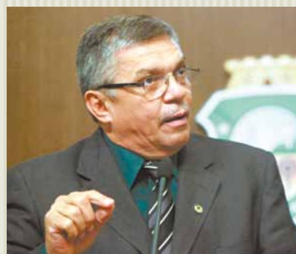
>> Deputado Delegado Cavalcante (PDT)