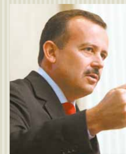
>> Deputado Neto Nunes (PMDB)