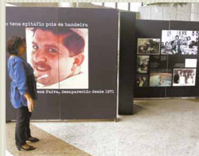
>> Aspecto da exposição sobre Rubens Paiva, no hall de entrada da Assembleia