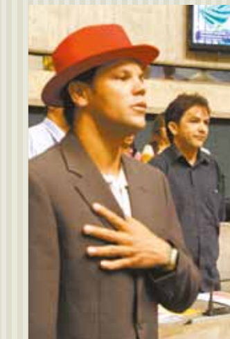
>> Sessão em homenagem ao Dia do Humorista