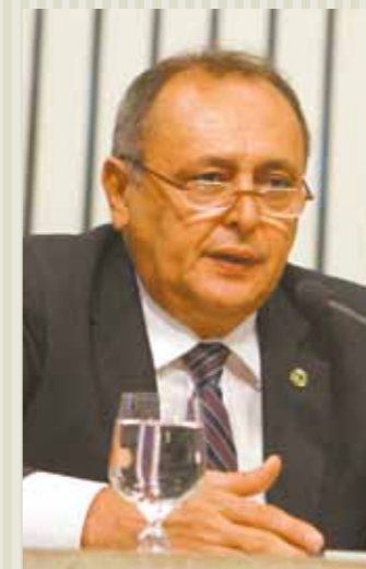
>> Deputado Sineval Roque (PSB)