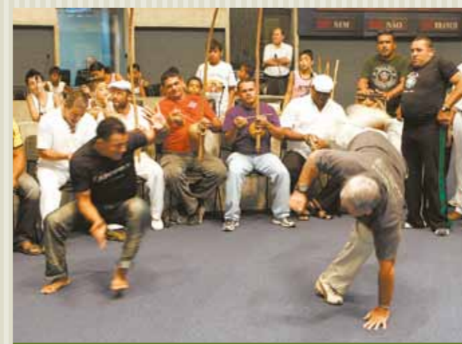
>> Grupo de capoeira faz apresentação no Plenário 13 de Maio