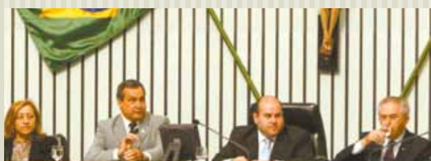
>> Audiência pública sobre direitos humanos no complexo das Comissões Técnicas

Foi lançado no dia 17/05 pelo Tribunal de Contas dos Municípios (TCM) em parceria com a Assembleia Legislativa do Ceará o Portal da Transparência para os municípios. A Casa realizou também audiência pública na Comissão de Direitos Humanos, com a presença da Ministra Maria do Rosário, da Secretaria especial dos Direitos Humanos da Presidência da República. No mesmo dia, no hall da AL, foi instalada a exposição "Não tens epitáfio, pois és bandeira: Rubens Paiva, desaparecido em 1971". A AL realizou ainda a comemoração dos 127 anos da libertação dos escravos, missa em ação de graças pelo Dia das Mães e homenagem ao Dia do Humorista.