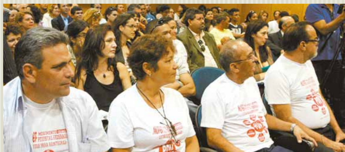
>> Audiência pública sobre direitos humanos no complexo das Comissões Técnicas