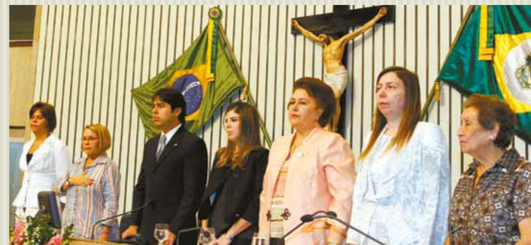
>> Sessão solene no Plenário em homenagem ao Dia Internacional da Mulher, presidida pelo deputado Téo Menezes (PSDB).