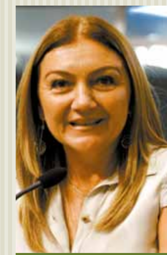
>> Deputada Inês Arruda (PMDB).