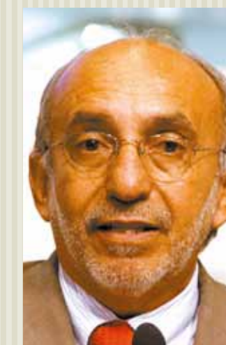
>> Deputado Lula Moraes (PC do B).