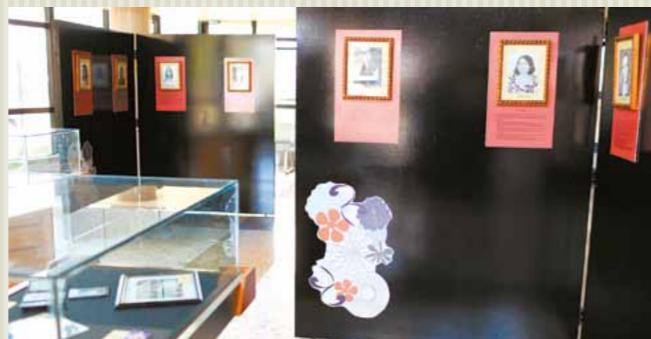
>> Painéis da exposição com a biografia das mulheres parlamentares do Ceará.