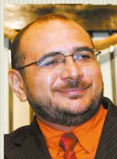
Líder do Governo, deputado Antonio Carlos (PT).