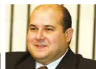
Presidente, deputado Roberto Cláudio (PSB)