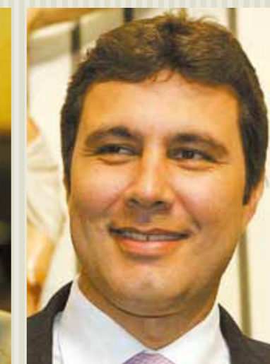
Deputado Stanley Leão (PTC).