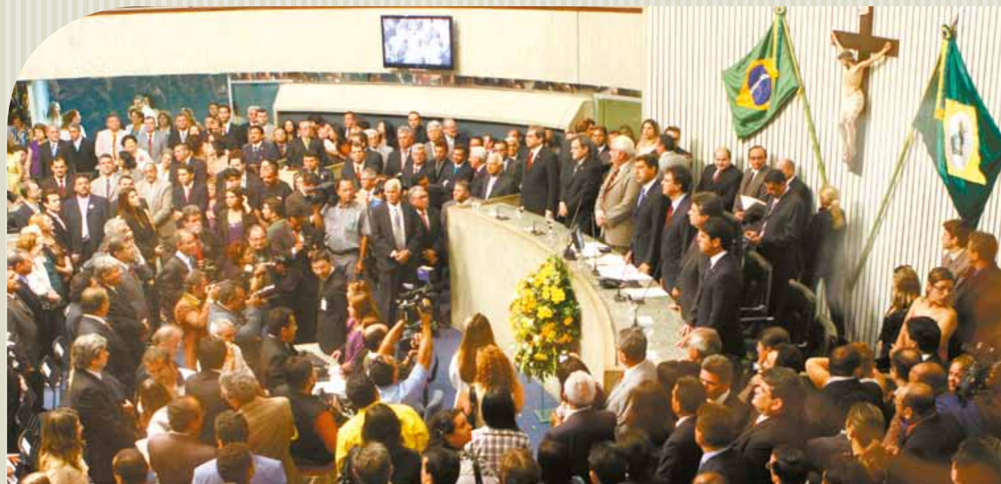
Vista do Plenário 13 de Maio durante a sessão preparatória de posse dos deputados.