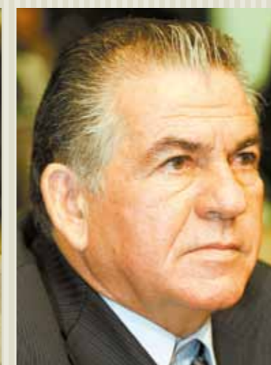
Deputado Rogério Aguiar (PSDB).