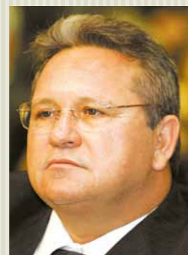
Deputado Roberto Mesquita (PV).