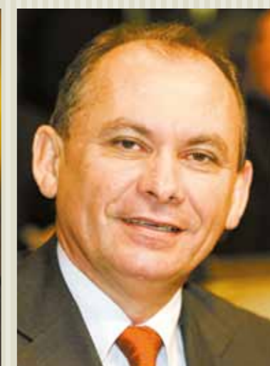
Deputado Nelson Martins (PT).