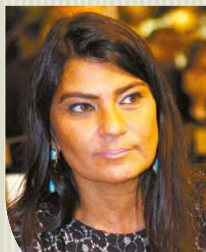
Deputada Patrícia Saboya (PDT).