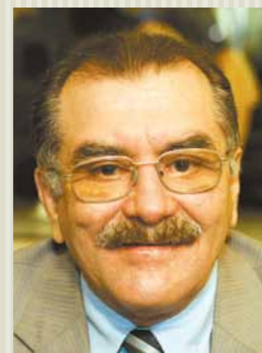
Deputado Lucílio Girão (PMDB).