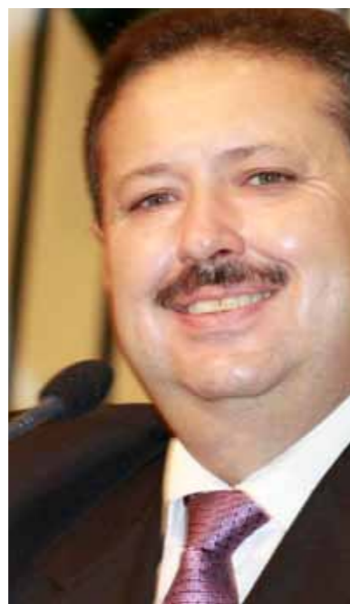
>> Deputado Domingos Filho (PMDB) preside o Colegiado dos Presidentes de Assembleias do Brasil.

O presidente do Colegiado dos Presidentes de Assembleias Legislativas do País (CPAL), deputado Domingos Filho (PMDB-CE), está articulando reunião conjunta da entidade com a União dos Legislativos do Brasil (Unale) para discutir a redistribuição do número de representantes de cada Estado nas casas legislativas, federal e estaduais, em função da estimativa populacional como prevê a Constituição do Brasil.