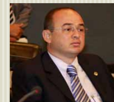
>> Deputado Sérgio Aguiar (PSB)