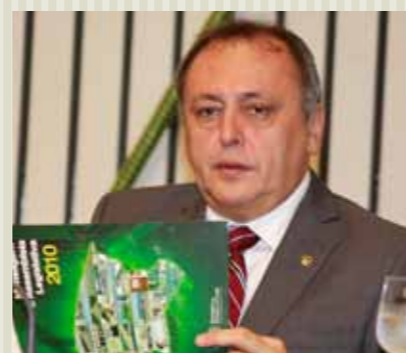
>> Deputado Sineval Roque (PSB).