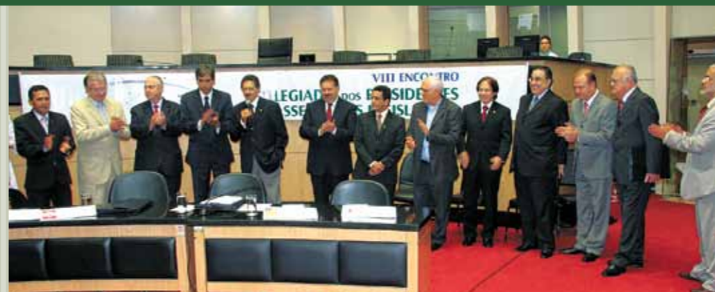
>> Domingos Filho (PMDB) é aclamado presidente do Colegiado das Assembleias Legislativas do Brasil