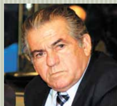
>> Deputado Rogério Aguiar (PSDB)