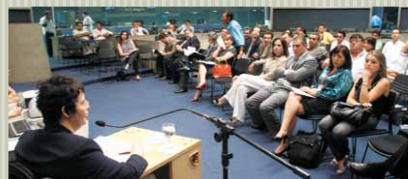
>> Participantes do Encontro assistem à palestra