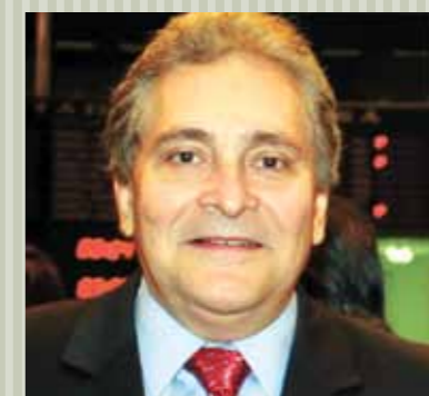
>> Deputado Luiz Pontes (PSDB)