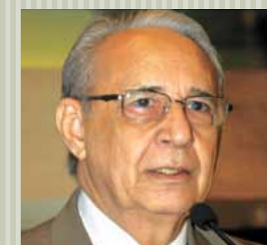
>> Deputado Guaracy Aguiar (PRB)