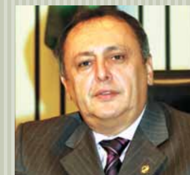
>> Deputado Sineval Roque (PSB)