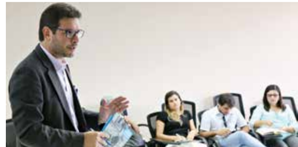
COOPERAÇÃO PÁGINA 2

Novembro Azul 2017 foca na conscientização para prevenir o câncer de próstata