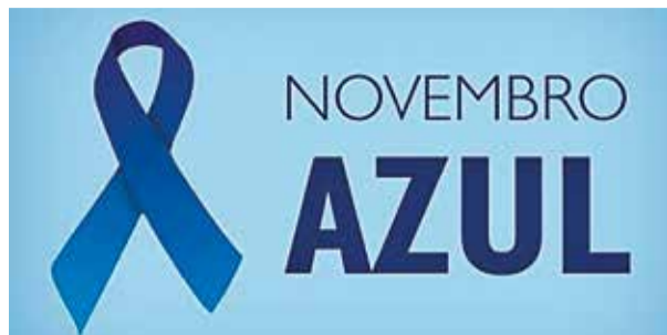
CAMPANHA PÁGINA 2

Programa quer perfurar, pelo menos, mais seis mil poços para minimizar crise hídrica