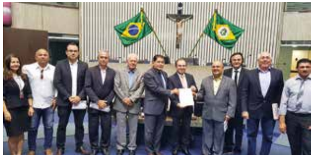
ÁGUA PARA BEBER PÁGINA 4

Programa quer perfurar, pelo menos, mais seis mil poços para minimizar crise hídrica