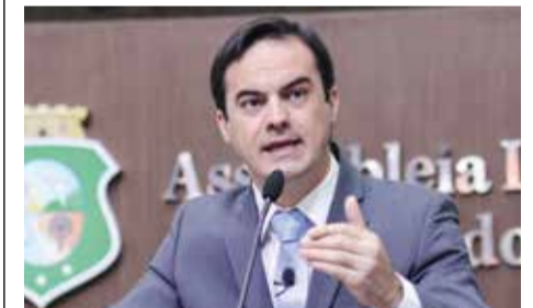
>> Capitão Wagner (PR)

Projeto de Indicação nº 112/17, de autoria do deputado Capitão Wagner (PR), em tramitação na Assembleia, concede isenção do pagamento de taxas estaduais relativas à renovação da Carteira Nacional de Habilitação (CNH) aos servidores públicos efetivos do Estado para os quais seja exigida a CNH para o exercício das suas funções. A isenção a que se refere o projeto também se estenderá às taxas referentes aos exames exigidos, realizados na Sede e nos Postos autorizados do Departamento de Trânsito do Estado do Ceará. O servidor deve exibir identidade funcional.