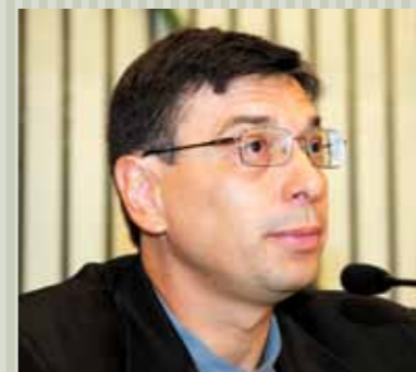
>> Márcio Pochmann, presidente do Ipea