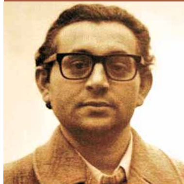
>>Frei Tito de Alencar em foto que se encontra no Museu do Ceará

Os versos foram encontrados na agenda de Frei Tito de Alencar. Havia sido escritos dias antes de sua morte, em 1974. Faltando um mês para completar 29 anos, seu corpo foi encontrado suspenso por uma corda, na área do Convento de Lyon, na França. Tito de Alencar nasceu em Fortaleza, em 1945. Foi um dos grandes ativistas brasileiros contra a repressão militar, durante os anos da ditadura no Brasil e tornou-se um dos símbolos da luta pelos direitos humanos. Foi preso, torturado e deportado. Passou por países como Chile, Itália e França; e submeteu-se a tratamentos psiquiátricos para amenizar os traumas das torturas sofridas no Brasil.