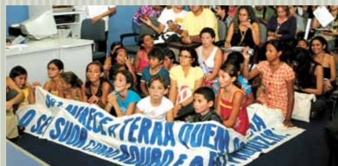
>> Membros da comunidade indígena Anacés em audiência pública que discutiu a desapropriação de suas terras, na Comissão de Direitos Humanos.