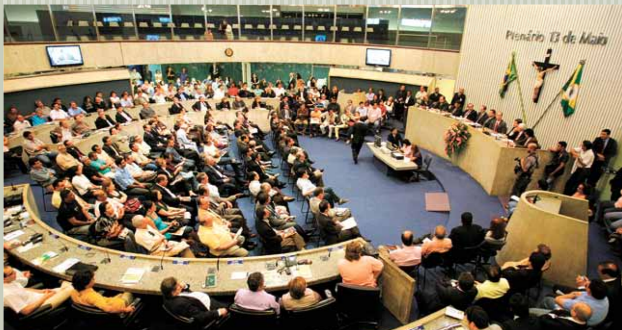
>> Vista do Plenário 13 de Maio durante o debate sobre os efeitos da crise financeira internacional sobre a Região Nordeste, realizado no dia 09/03

O Plenário 13 de Maio foi palco de grande movimentação em março, iniciada com um debate sobre os efeitos da crise financeira internacional sobre o Nordeste, seguida de sessões comemorativas ao Dia Internacional da Mulher e a um ano de criação do Juizado de combate à violência contra a mulher. Foram realizadas sessões para comemorar os 100 anos do poeta Patativa do Assaré e de Dom Helder Câmara, e outra em homenagem ao ex-presidente João Goulart. A Casa recebeu também os povos indígenas Anacés e os servidores da Casa elegeram a nova diretoria da sua entidade, a Assalce.