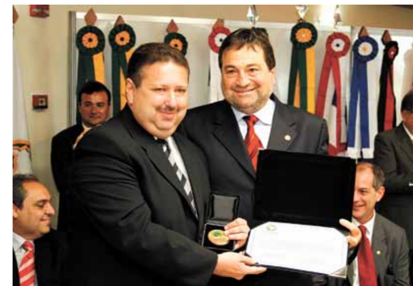
> Presidente Domingos Filho recebe homenagem do presidente da Unale, deputado César Halum (TO), durante encontro da entidade em Natal (RN)

O presidente Domingos Filho foi homenageado pela União Nacional dos Legislativos Estaduais (Unale) com um troféu e um certificado, pelos relevantes serviços prestados pela Assembleia do Ceará à entidade. A solenidade aconteceu durante o II Encontro Regional da entidade realizado em Natal (RN) nos dias 05 e 06/03. No encontro, que teve como tema a Transposição das Águas do Rio São Francisco, Domingos foi mediador do painel que trata do tema e defendeu a execução imediata da obra. Realizado na sede do Poder Legislativo do Rio Grande do Norte, o encontro também serviu para discutir a distribuição de energia na Região.