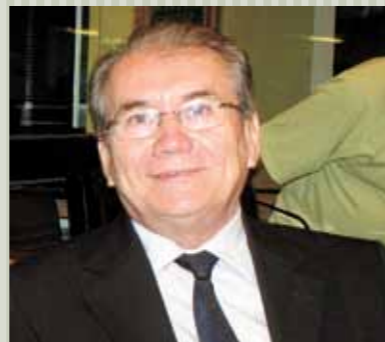
>> Deputado Vasques Landim (PSDB).