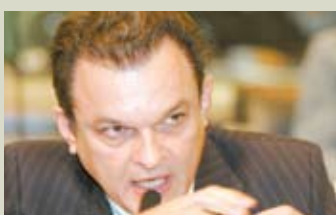
>> Dep. José Sarto (PSB)