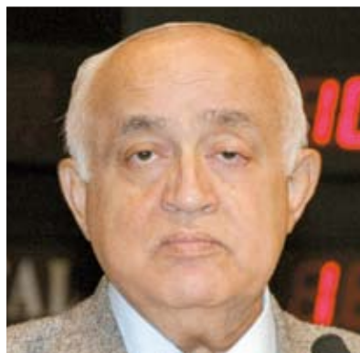
Deputado Prof. Teodoro (PSDB)

Dia Estadual da Infância não deve ser apenas lúdica e recreativa. Precisamos de políticas públicas efetivas para garantir o desenvolvimento harmônico e integral da criança", ressalta ela. Ainda por sua iniciativa, foi criado o Dia Estadual da Criança no Rádio e na TV, a ser celebrado anualmente, no segundo domingo de dezembro, junto com o Dia Internacional. O objetivo da deputada é garantir a informação de qualidade e estimular a participação de crianças e adolescentes nos meios de comunicação.