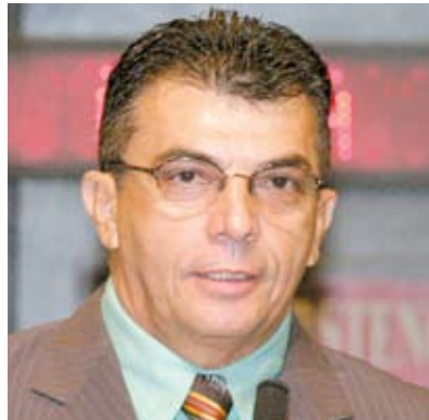
Deputado Ely Aguiar (PSDC)