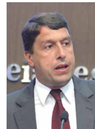
>>Deputado Gony Arruda (PSD)