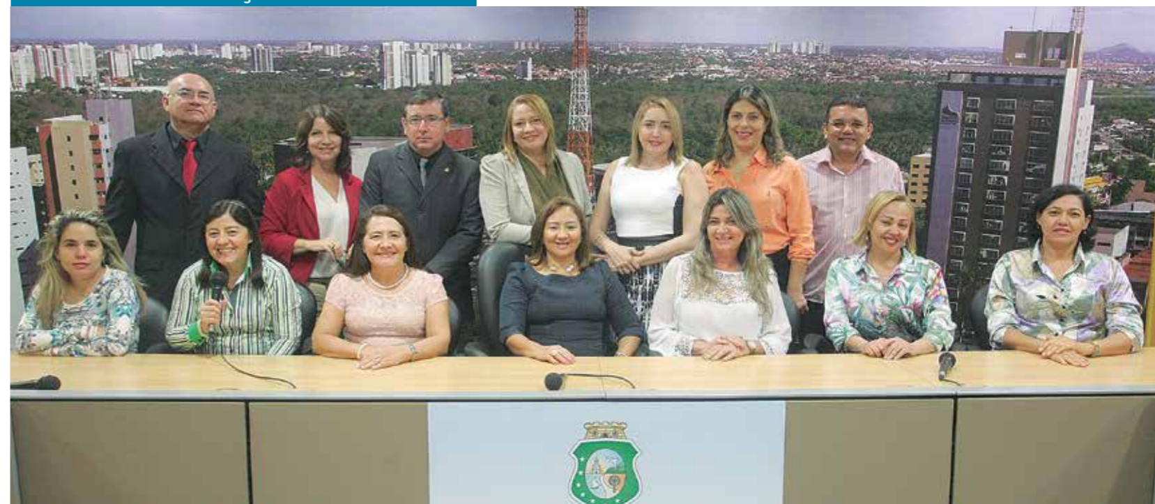
Equipe da Consultoria na homenagem realizada no Complexo das Comissões