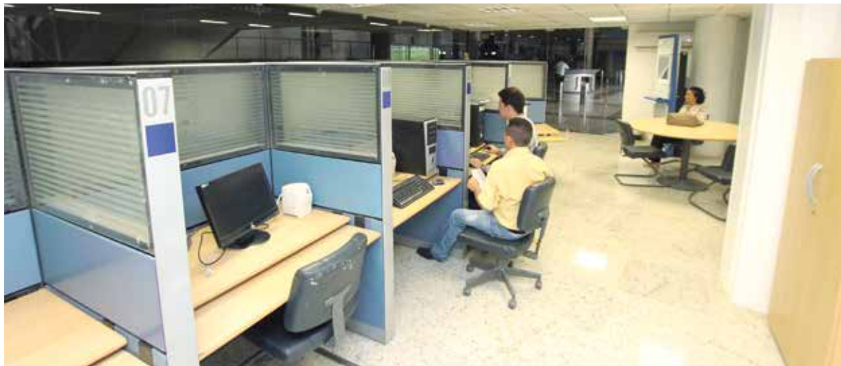
O Espaço do Povo com instalações reformuladas e modernizadas

Por iniciativa da Mesa Diretora, o local se estruturou para melhorar atendimento à população.