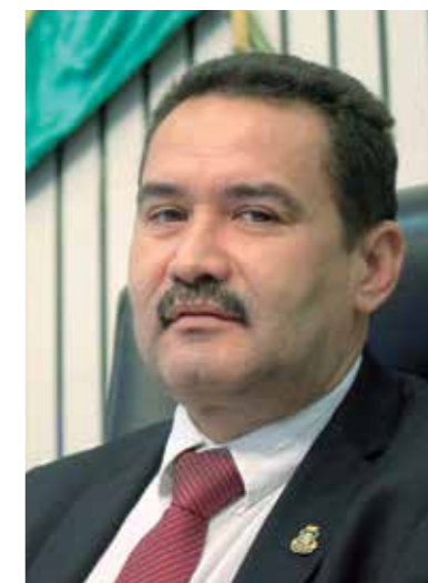
>>Deputado Moisés Braz (PT)