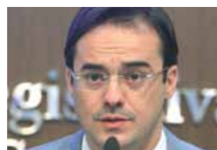
>> Capitão Wagner (PR)

Projeto de lei 31/15, de autoria do deputado Capitão Wagner (PR), obriga a contratação de Bombeiro Civil e manutenção de unidade de combate a incêndio e primeiros socorros em estabelecimentos privados que receba grande concentração de pessoas tais como shopping, casas de show, hipermercados, lojas de departamento, hospitais particulares e prédios comerciais. A proposta, que está em tramitação na Assembleia, estabelece que cada unidade de combate a incêndio tenha pelo menos um bombeiro civil por turno para cada 1.500 pessoas que circulem no estabelecimento.