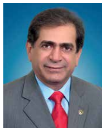
>> Deputado Zezinho Albuquerque Presidente da Assembleia Legislativa do Estado do Ceará

O Ceará está diante do quarto ano consecutivo com chuvas abaixo da média histórica. As baixas precipitações registradas até agora, vem confirmando os prognósticos da Funceme e são preocupantes. A Assembleia Legislativa está totalmente mobilizada para prevenir possíveis efeitos dos baixos níveis de nossas reservas hídricas. Estamos intensificando ações de conscientização da sociedade, por meio dos meios de comunicação do Legislativo, para o uso racional da água pela população. É o momento de economizar para não faltar.