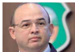
>> Sérgio Aguiar (Pros)

Projeto de lei 34/15, do deputado Sérgio Aguiar (Pros), assegura ao consumidor o direito de livre escolha da oficina mecânica em casos de cobertura dos danos em veículos por seguradora. O mesmo direito se estende também ao terceiro envolvido no sinistro e que deve ser ressarcido pela seguradora. As seguradoras não poderão criar qualquer obstáculo ou impor tratamento diferenciado em razão do exercício de livre escolha proposto, ficando vedada a imposição de qualquer tipo de relação de oficinas que limite a escolha do segurado ou do terceiro, como condição para o conserto dos veículos.