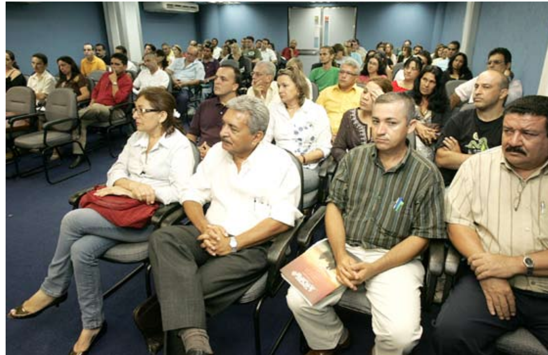
>> Aprovados no vestibular assistem aula inaugural

Para quem já possui graduação, a instituição oferece três cursos de especialização, entre os quais, dois em parceria com a Universidade de Fortaleza (Unifor): Comunicação e Jornalismo Político e Direito Parlamentar e Política; e outro com a Faculdade Farias Brito, de Assessoria Legislativa. A iniciativa do Parlamento Cearense, inédita no Brasil, também rendeu outras importantes parcerias: Além da Unifor, também foram firmados convênios com a Universidade Vale do Acaraú (UVA), Faculdade Farias Brito, e outras parcerias. As inscrições para os cursos de pós-graduação seguem até o dia 29 de fevereiro e podem ser feitas na sede da Universidade do Parlamento localizada na Avenida Pontes Vieira 2391. Mais informações pelo fone 3257-7871 ou no site www.al.ce.gov.br/unipace .