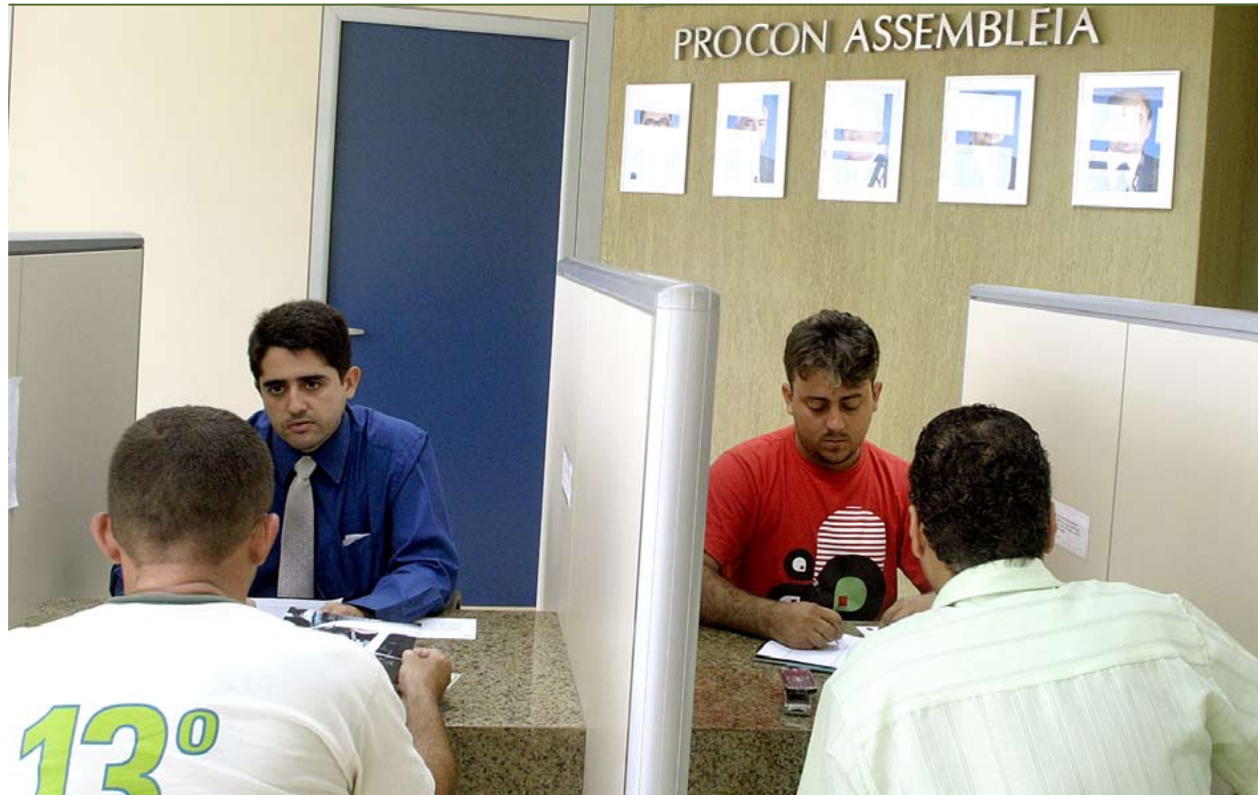
>> Atendimentos do Procon triplicaram em quatro anos