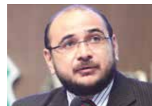
>> Dep. Antônio Carlos (PT)

A distribuição gratuita de livros de autores cearenses aos estudantes das escolas públicas estaduais foi proposta por meio de projeto de indicação pelo deputado Antônio Carlos (PT), em apreciação na Assembleia. Segundo ele, a literatura, como expressão da experiência humana em suas dimensões históricas e estéticas, se revela um baluarte do conhecimento, pois traz em si a capacidade de transmitir às gerações atuais e futuras aspectos que muito contribuem para a compreensão da formação histórica e social de cada povo, suas particularidades e seus valores.