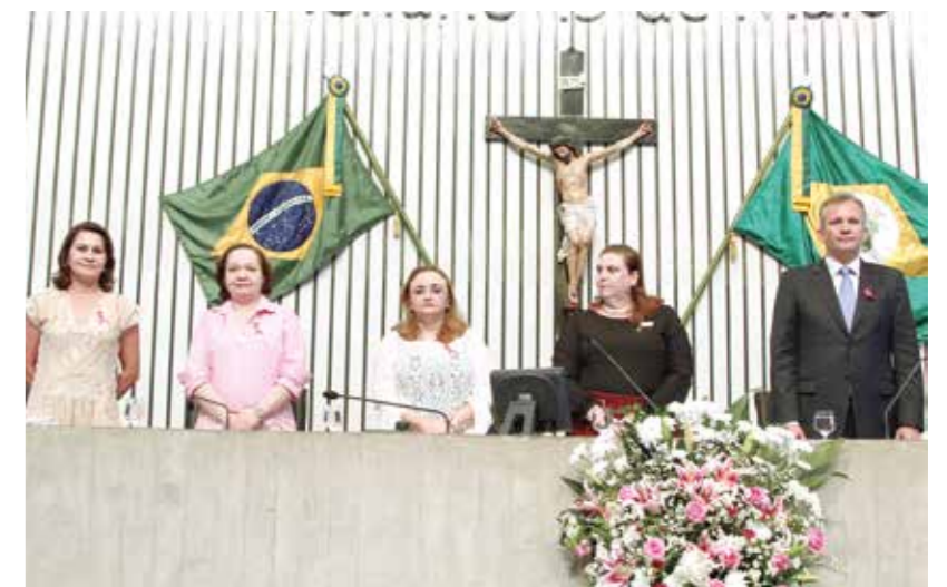
>> Mesa da sessão solene comemorativa ao Outubro Rosa