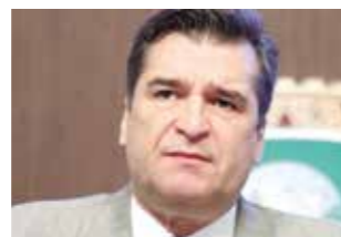
>> Dep. João Jaime (DEM)

O parcelamento em 10 mensalidades sem acréscimos do Imposto sobre Propriedade de Veículo Automotor (IPVA) foi proposto na Assembleia, por meio de projeto de lei de autoria do deputado João Jaime (DEM). O projeto, em apreciação no Legislativo, estabelece ainda que será contemplado com um desconto a ser fixado pelo Executivo, o contribuinte que optar pelo pagamento à vista e em sua totalidade, a realizar-se no mês de fevereiro de cada ano. No caso do parcelamento, as contribuições pagas em atraso serão passíveis de juros e multa, estabelece o projeto.