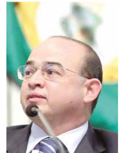
>> Deputado Sérgio Aguiar (Pros)