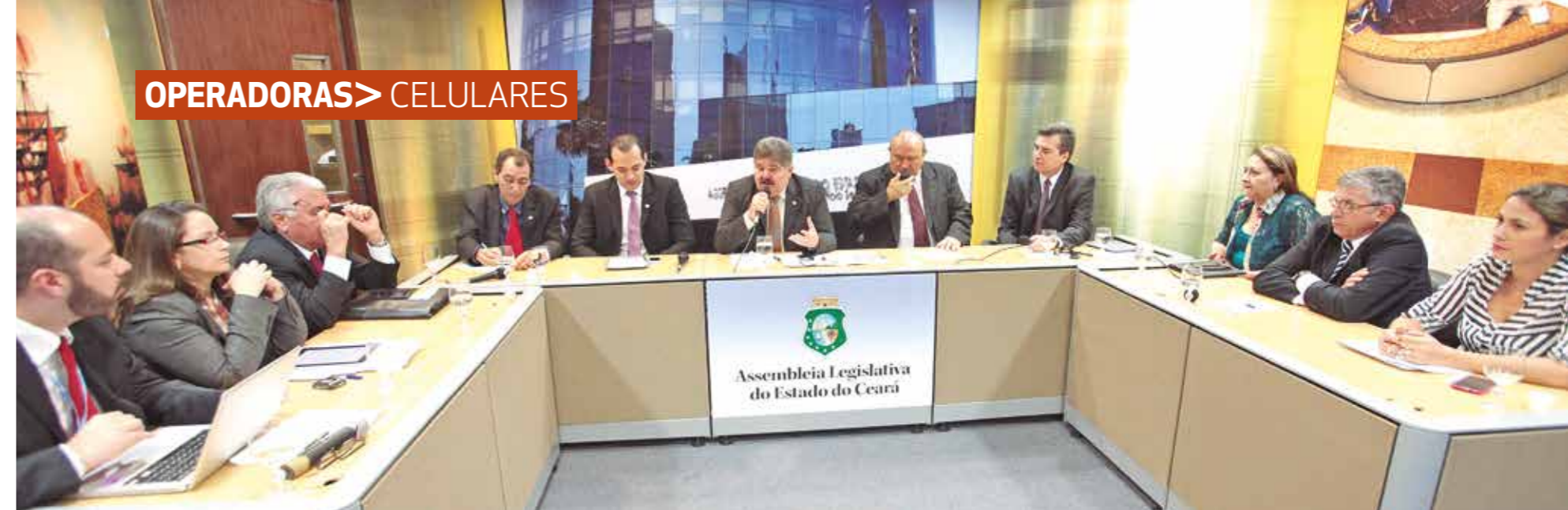
>> CPI da Telefonia Móvel em reunião que recebeu o representante da Anatel.