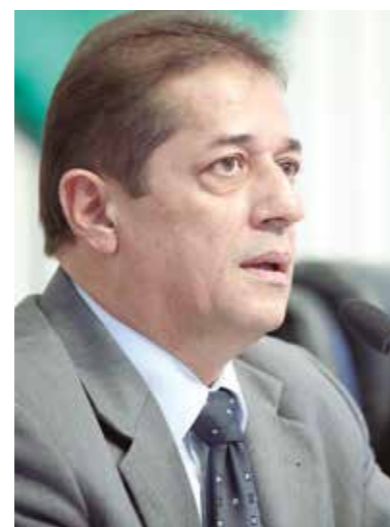
>> Secretário da Segurança, Sevilho de Paiva.