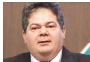
>> Dep. Osmar Baquit (PSD)

Projeto de Indicação, de autoria do deputado Osmar Baquit (PSD), concede isenção do pagamento de taxas estaduais relativas à primeira emissão e à renovação da Carteira Nacional de Habilitação (CNH) às pessoas com deficiência, emitidas pelo Departamento de Trânsito (Detran-CE). Pela proposta em apreciação na Assembleia, as pessoas beneficiadas pela isenção prevista poderão realizar os exames médicos necessários à emissão e à renovação da Carteira Nacional de Habilitação (CNH) nos estabelecimentos da rede pública de saúde do Estado do Ceará.