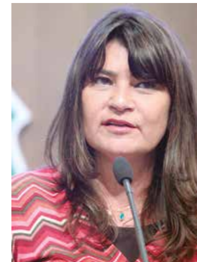
>> Deputada Patrícia Saboya (PDT)