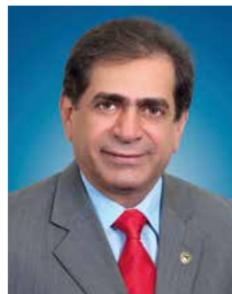
>> Deputado José Albuquerque Presidente da Assembleia Legislativa do Estado do Ceará

Enfrentamos atualmente o grave problema da disseminação e do uso de drogas. A Assembleia Legislativa, que já lançou o Pacto Pela Vida – um amplo diagnóstico e plano de ação para o enfrentamento do problema – quer envolver ainda mais toda a sociedade na busca de soluções para a dependência química. Por isso, lançamos a campanha "Ceará sem Drogas".