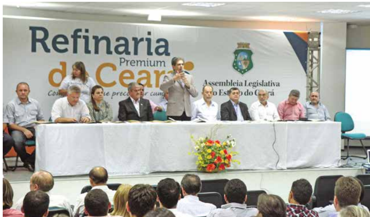
>> Seminário da Região Metropolitana foi realizado em Aquiraz

A solenidade de premiação da melhor redação do concurso de redação “Refinaria Premium do Ceará”, aconteceu no dia 5 de dezembro, no Auditório João Frederico Ferreira Gomes - anexo II da Assembleia. As escolas dos três alunos vencedores serão premiadas com aparelhos de data-show, além de troféus. O primeiro colocado ganhará um smartphone, o segundo um tablet de 10 polegadas e o terceiro um tablet de sete polegadas. O vencedor de cada escola será certificado e convidado a participar da solenidade, como também seus professores orientadores. As redações são submetidas a uma comissão julgadora, formada por representantes da Seduc, Universidade do Parlamento (Unipace) e do