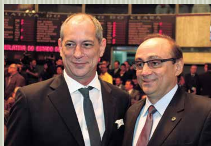
>> Ex-ministro Ciro Gomes e o deputado Tin Gomes (PHS), 1º vice-presidente.