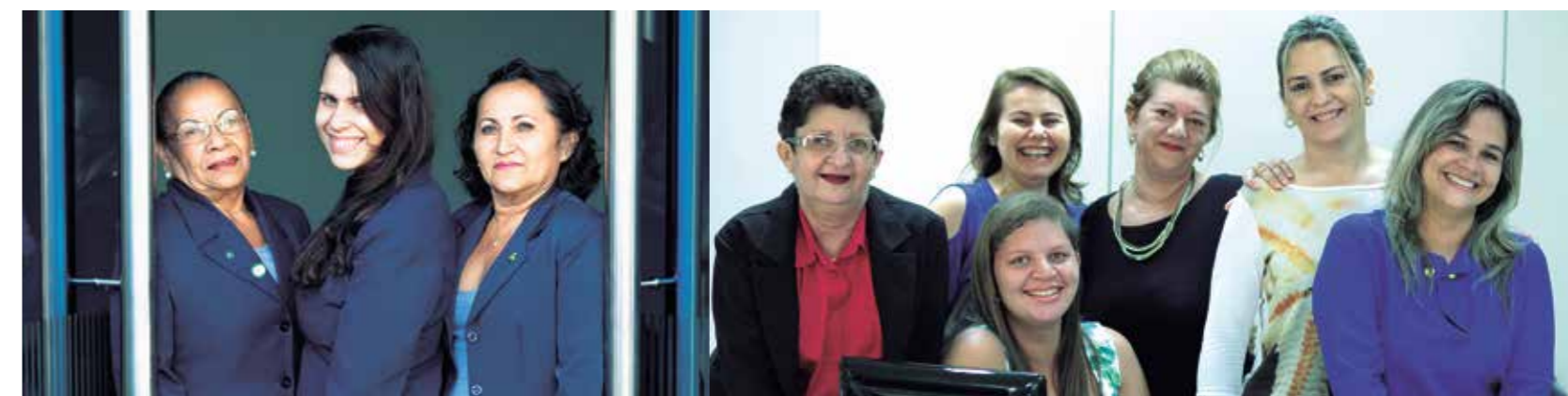
>> Recepcionistas do complexo das Comissões Técnicas.

Parlamento conta com nove deputadas estaduais, um marco na sua história