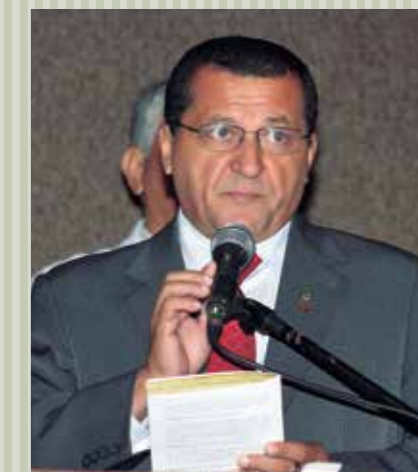
>> Deputado Dedé Teixeira (PT), 4º secretário da Mesa.