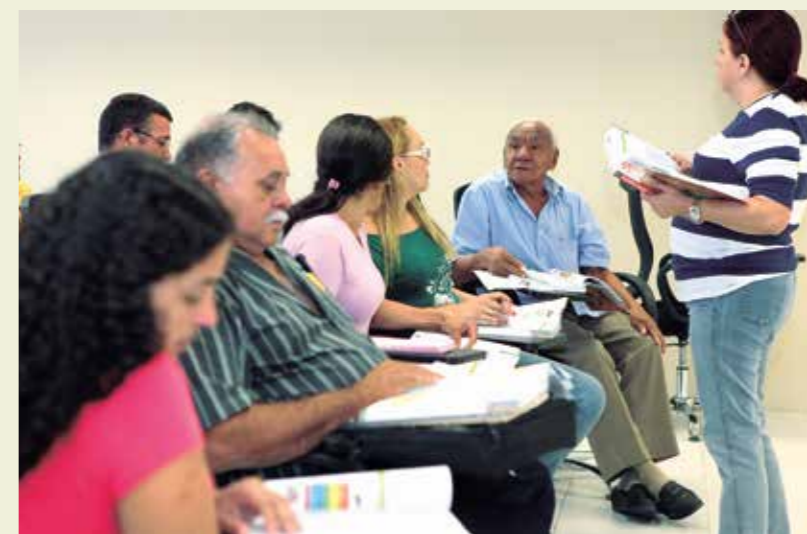
>> Alunos do Projeto de Superação em sala de aula.