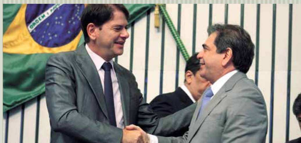
>> Empossado, o presidente José Albuquerque (PSB) recebe cumprimentos do governador Cid Gomes.