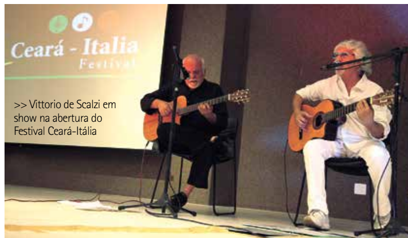
>> Vittorio de Scalzi em show na abertura do Festival Ceará-Itália

Representante do Governo do Estado, o secretário de Cultura Francisco Pínhireiro disse que este é o início de uma forte relação cultural com a Itália e uma oportunidade para apresentar outra face do Ceará na Europa. "É de grande relevância mostrar que o nosso Estado tem, além de praia e sol, gastronomia e cultura", afirmou.