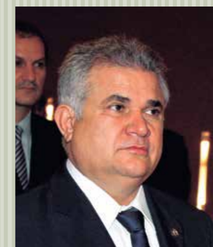
>> Deputado Vanderley Pedrosa (PTB)