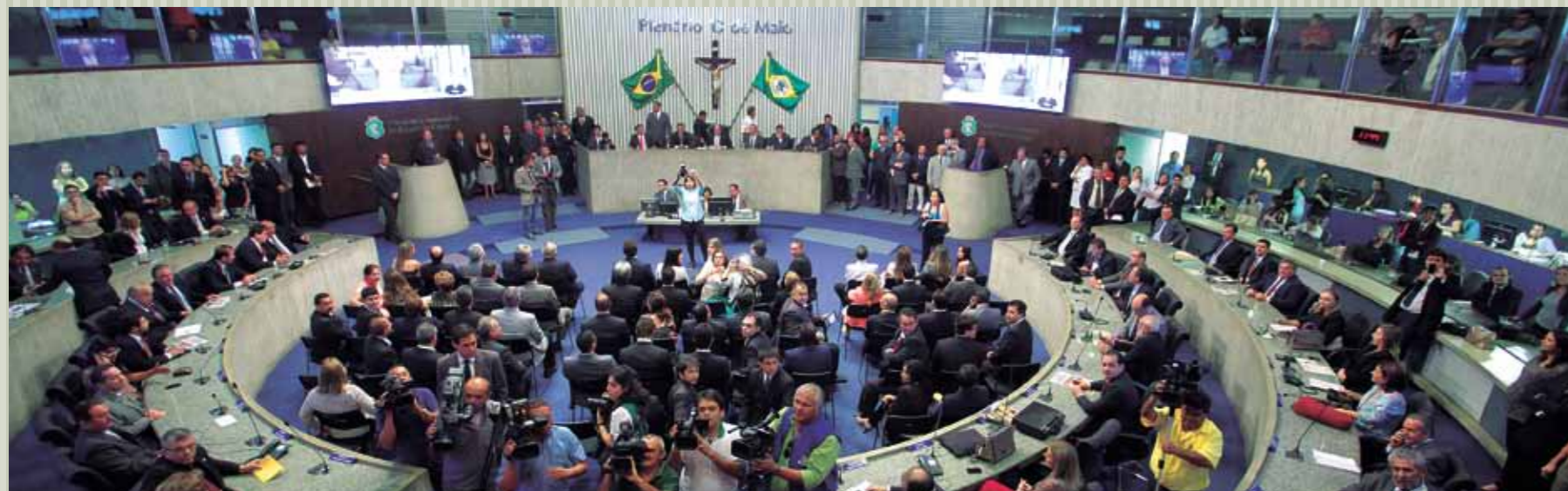
>> Vista do Plenário 13 de Maio durante a sessão que elegeu a nova Mesa Diretora para o biênio 2013-2014.