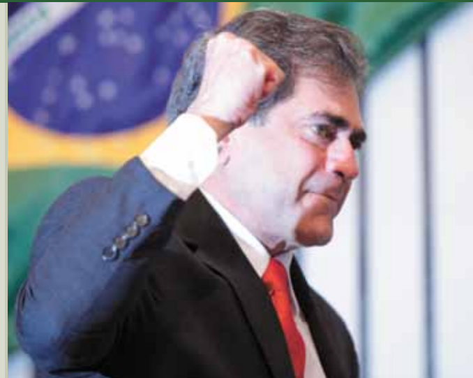
>> Deputado José Albuquerque (PSB), presidente eleito da AL, comemora a vitória.