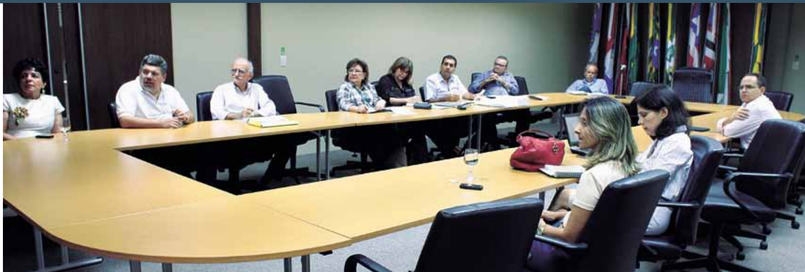
>> Diretores da AL e consultores da Fundação Dom Cabral na última reunião de planejamento de 2012