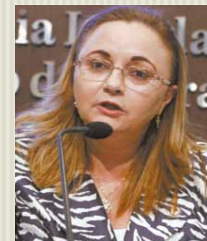
&gt;&gt; Deputada Eliane Novais (PSB)