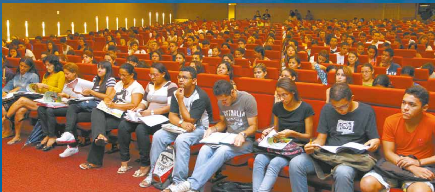
>> Alunos do ALcance a Universidade na primeira aula do cursinho.

Programa iniciou já em processo de interiorização, levando as aulas também a Tauá, por meio de videoconferência.