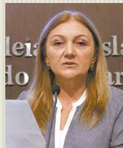
&gt;&gt; Deputada Inês Arruda (PMDB)