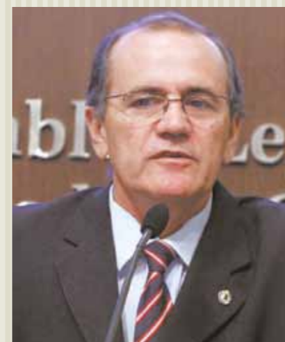
&gt;&gt; Deputado Antônio Granja (PSB)