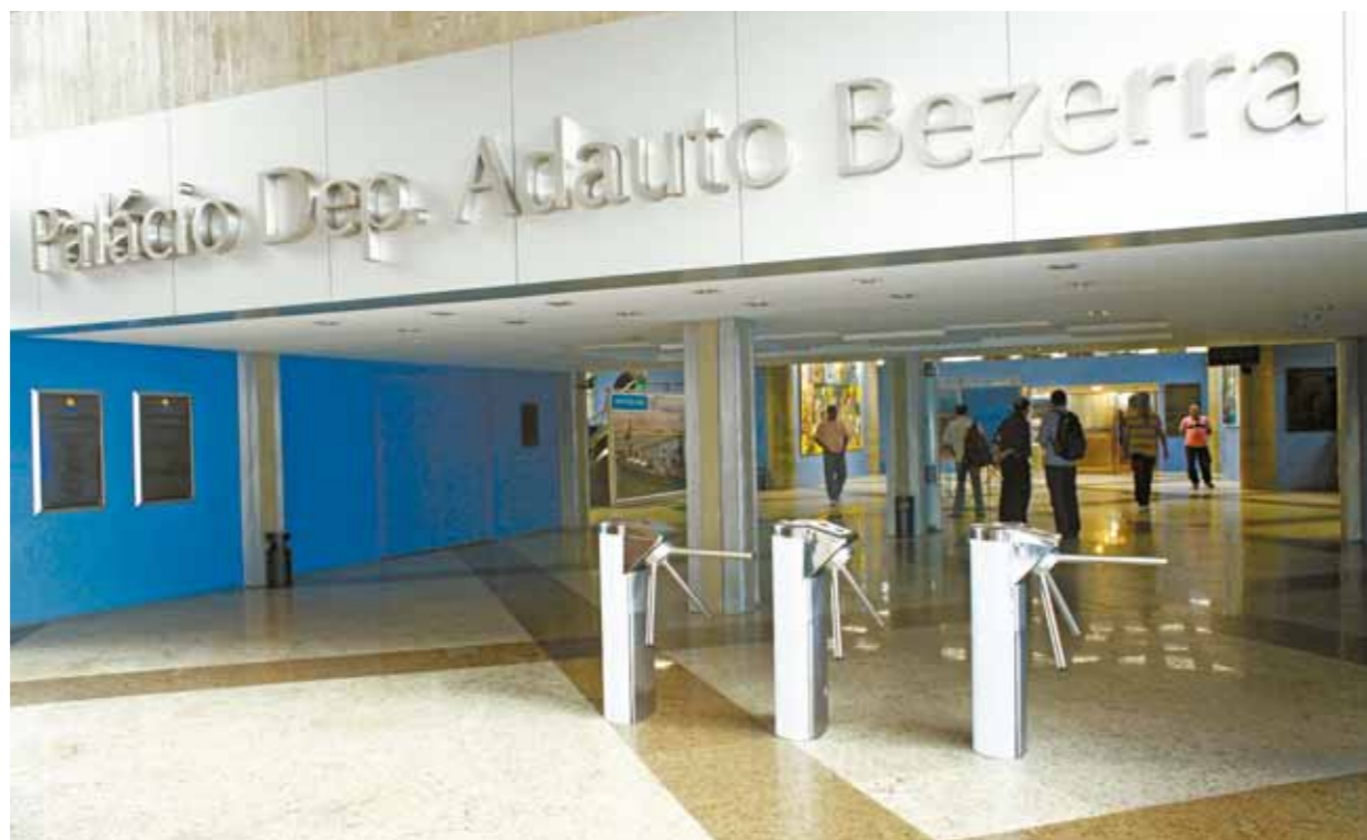
>> Catracas já estão sendo montadas nos principais acessos ao prédio do Legislativo.